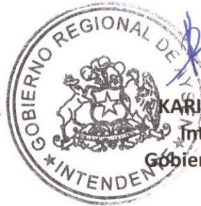
KARINA ACEVEDO AUAD Intendente, Ejecutivo Gobierno Regional de Aysén