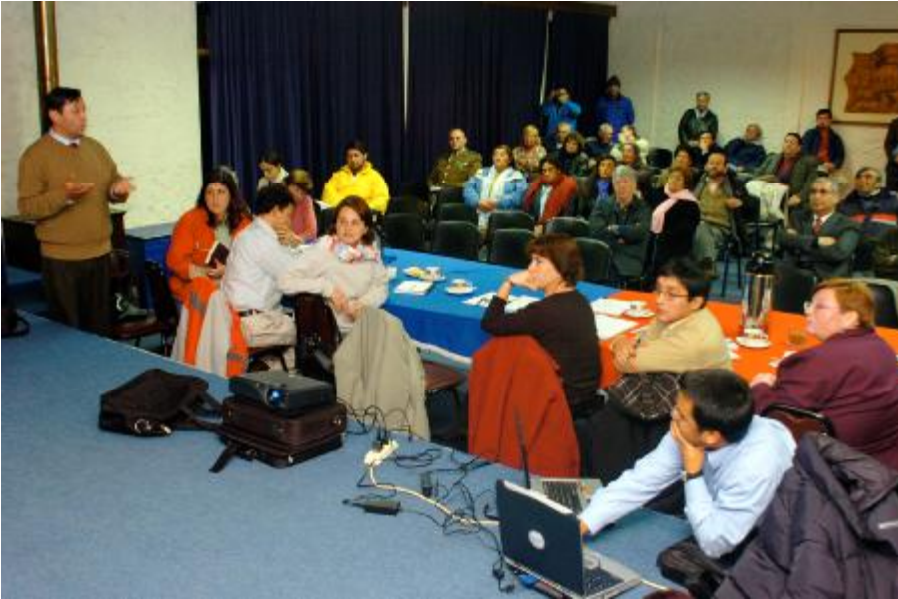
Figura 4.1: Reunión efectuada por la Intendente Regional junto al Gabinete, Concejo Comunal y Comunidad, en Cochrane.