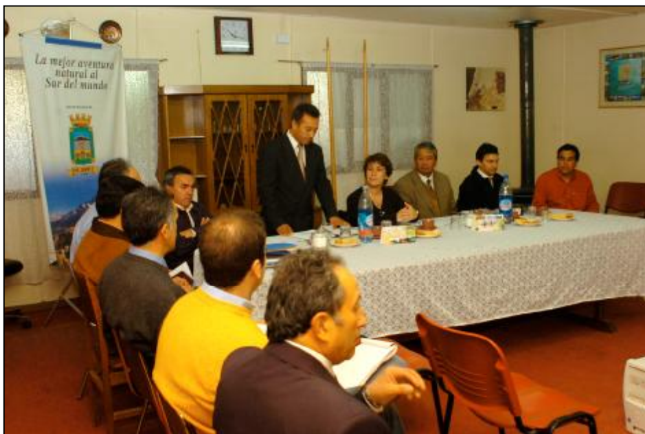
Figura 2.4: Reunión con el Concejo Comunal de Río Ibañez